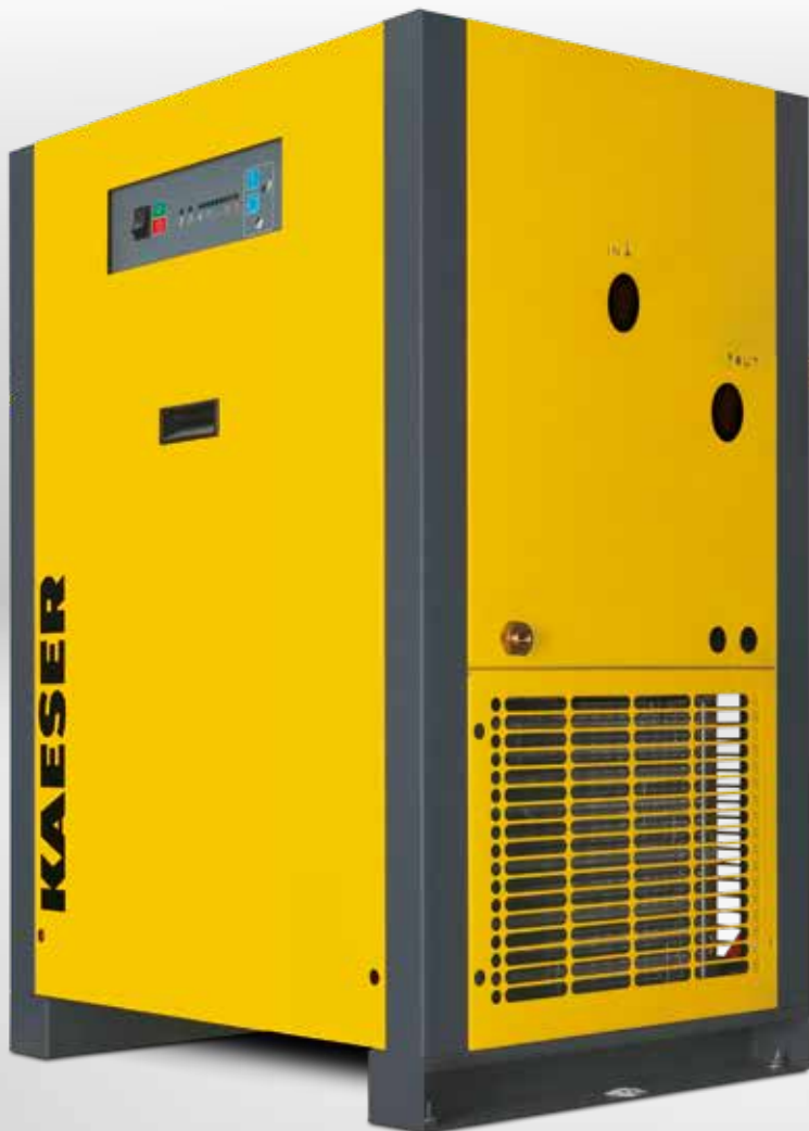
THP 40-50 Version standard